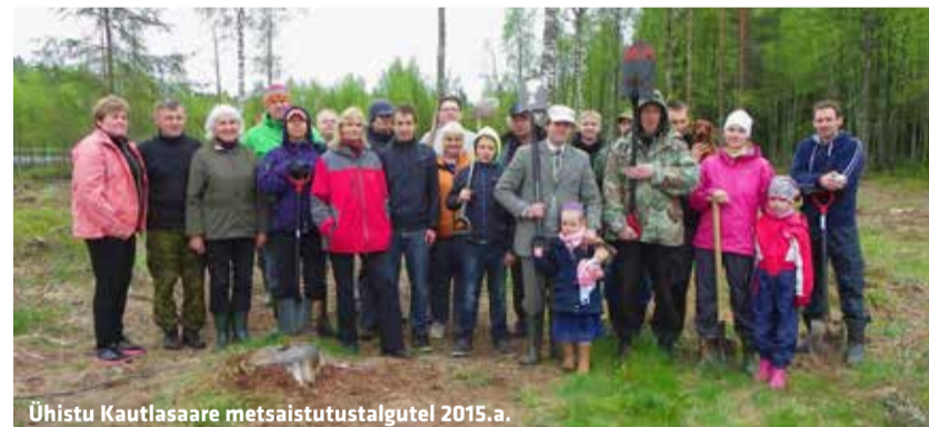
Ühistu Kautlaseare metsaistutustalgutel 2015. a.

Ja neid seadusi ja määrad ja haldusakte tuleb järjest juurde. Peale selle mõeldakse neisse veel igasuguseid uusi sõnu välja, mille kallal või mille mittekasutamise pärast võib vinguda. Olgu nendeks siis „harvikaigused“ või seesama „panustamine“, mida tehakse igasse nurka, aga millest keegi õieti aru ei saa. Ja mis kõige hullem, tundub, et iga niisuguse seaduse või määradega tuleb juurde neid, kes peavad selle kasvõi paberi peal täitmist kontrollima ja saavad nüüd nina püsti ajada ja su koju uute paberite järgi saata. Ja muidugi võimalusel ka trahvida. Tundub juba, et