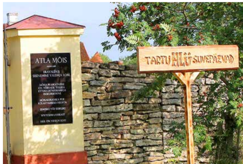
Atla mõisa keraamikatehases valminud omanäoliste toodetega saate tutvuda mõisa kodulehel: www.keraamika.ee

Meile jultustatav nn. vaba konkurents ja liberaalne turumajandus on liiga lähedal parasiteerimisele rahva arvelt, liiga lähedal varjatud ja avalikele monopolidele, mis ütlevad