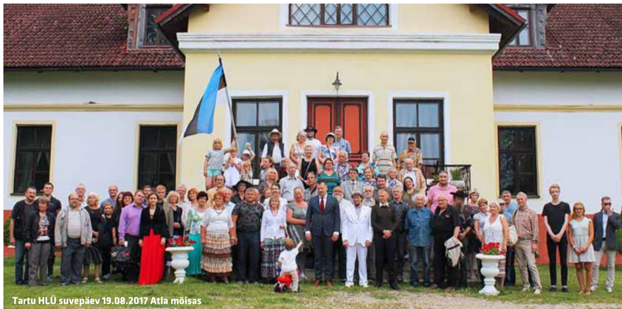
Tartu HLÜ suvepäev 19.08.2017 Atla mõisas

Ühest küljest on see ka õige, sest kui täna küsida, kelle huvides on Rail Baltic, siis on vastus jätk ja selge: Rail Baltic on kõigi nende huvides, kes siseinfole tuginedes onstid kokku maatükid, kust see monstrum läbi peab mine- ma, nende huvides, kes