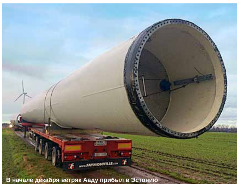
В начале декабря ветряк Ааду прибыл в Эстонию