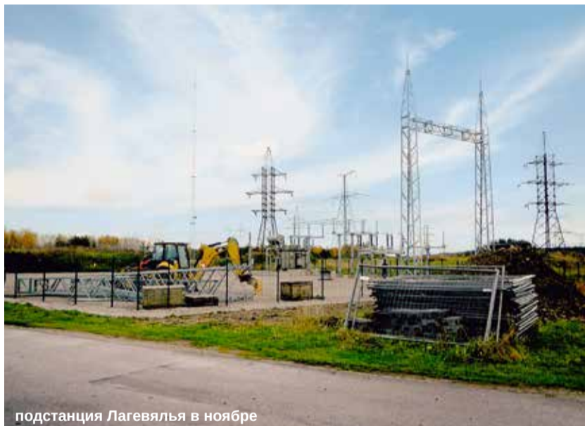
подстанция Лагевяля в ноябре