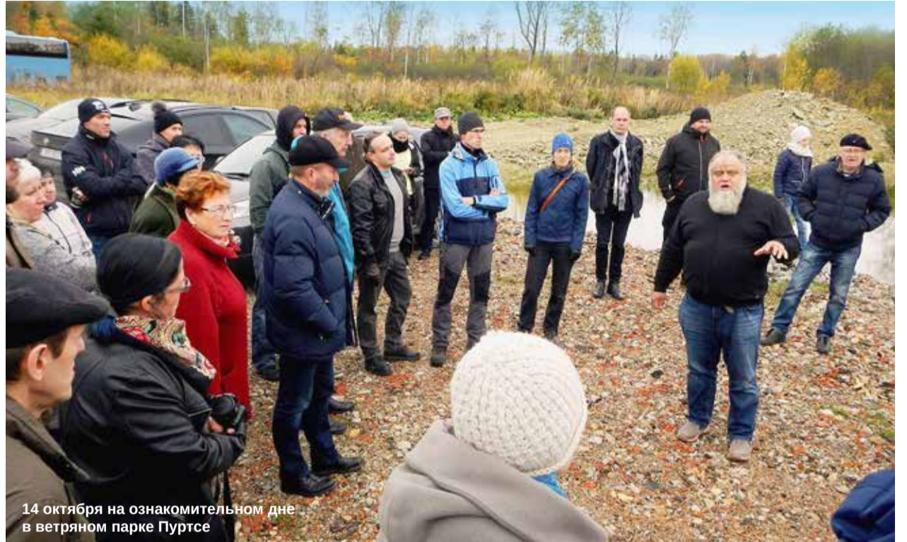
14 октября на ознакомительном дне в ветряном парке Пуртсе

Прекрасно то, что в день знакомства я не увидел ни в чьих глазах алчности или зависти, лишь гордость и радость от достигнутого общими силами. В день знакомства