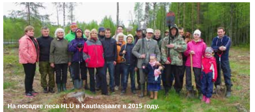
На посадке леса HLÜ в Kautlassaare в 2015 году.

Так что вот мое предложение по поводу совместной деятельности. «Государство» должно