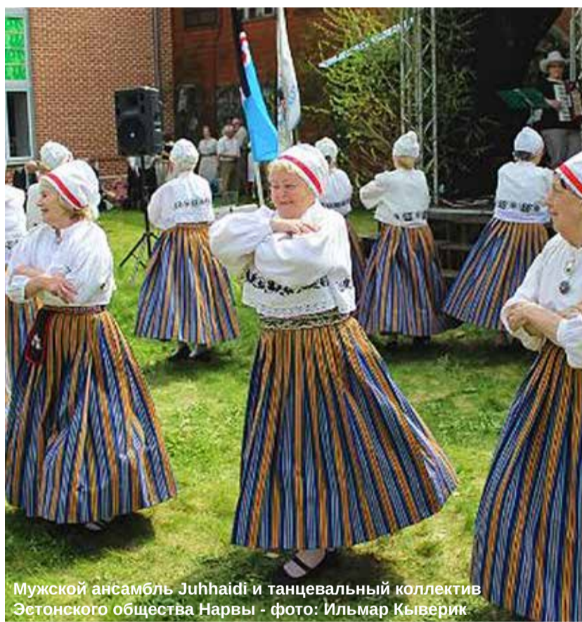
Мужской ансамбль Juhhaidi и танцевальный коллектив Эстонского общества Нарвы

Другой родины у нас нет. Здесь зародилась наша культура, наш язык, наша вера. Тут родились наши предки.