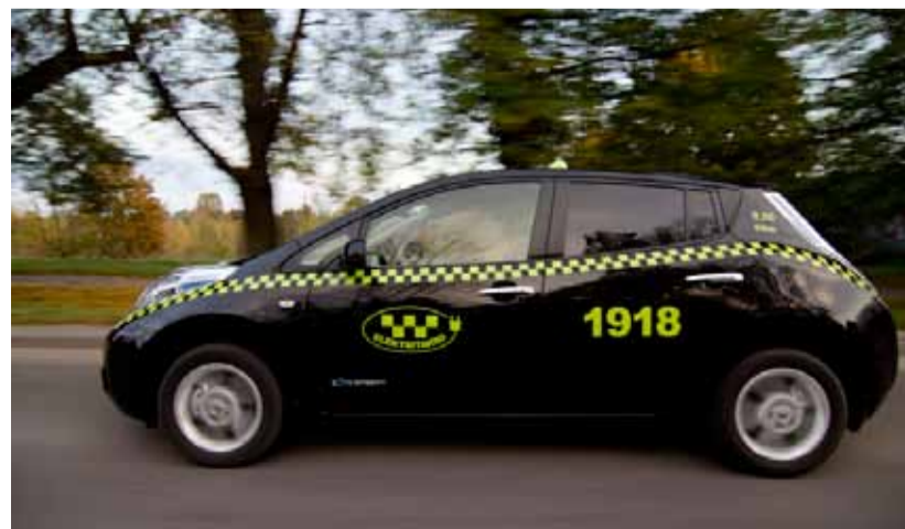
Ka Tartus on vekslite eest võimalik takso tellida! Ülevaade Elektritakso tegevusest anname järgmises Ühistulehes.