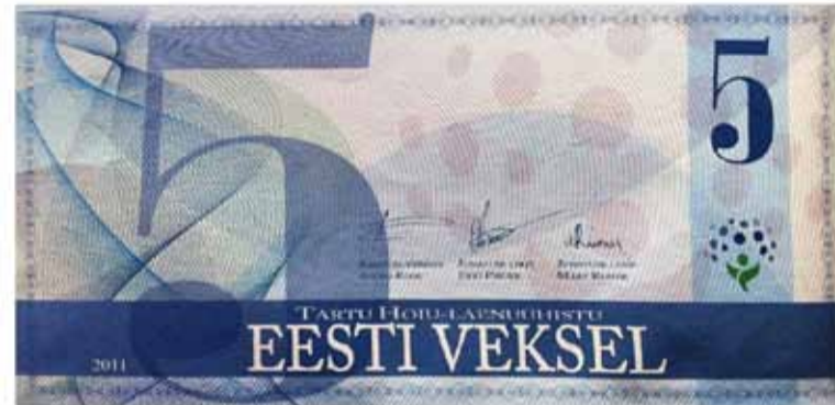
Järjest rohkemates ettevõtetes saab lisaks eurodele maksta ka meie oma Eesti veksliga.

Nõmme südames Pärnu mnt 326 tegutseb Tartu Hoiu-laenuühistu Tallinna kontor. Ühistu Tartu kontor asub Tartu südames aadressil Raekoja plats 20. Tartu Hoiu-laenuühistu on kaasaegne ühistuline finantseerimisasutus, mille tegevus on suunatud oma liikmetele finantsteenuste pakkumisele. Ühistu võtab liikmetelt hoiuseid, annab laenu, liisingut, faktooringut, väljastab garantiikirju ning korraldab