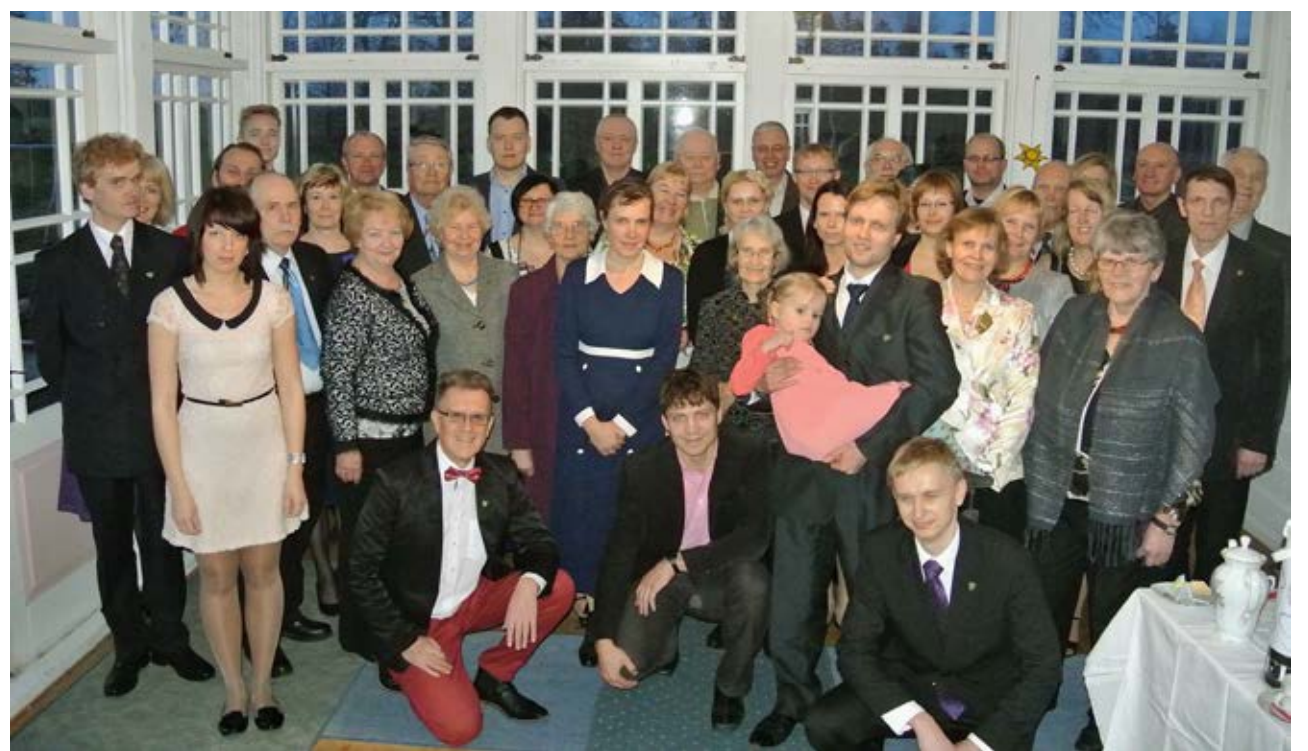
Eesti ühistegevuse 113. sünnipäeva tähistamisest osavõtjad 30.04.2015 Kursi Jahilossis

Ühistegevuslikud majandusettevõtted on laialt levinud tihti eeskujuks toodavates riikides nagu Soomes, Saksamaal ja Ameerikas. Et ka Eesti jõuaks majanduslikult nii kaugele nagu mainitud riigid, tuleb tundma õppida ühistegelike ettevõtete