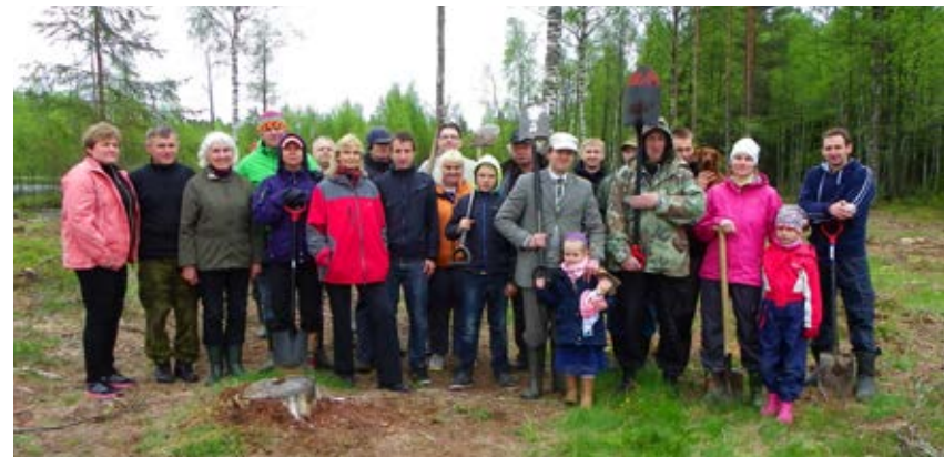
Ühistu Kautlasaare talgutest osavõtjad 23.05.2015