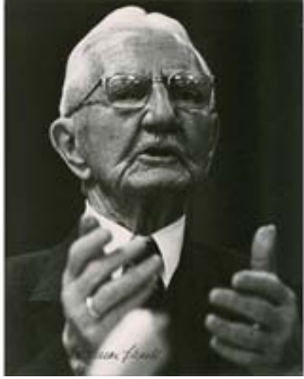
Dr. Hjalmar Horace Greeley Schacht

Dr. Hjalmar Horace Greeley Schacht (22. jaanuar 1877 - 3. juuni 1970) oli saksa majandusteadlane, pankur, liberaalne poliitik ja Saksa Demokraatliku Partei asutaja. Ta oli Saksa keskpanga – Reichsbank – president aastatel 1923-1930 ja 1933-1939 ning Saksamaa majandusminister 1934-1937.